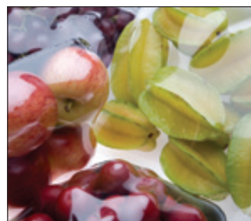
Película transpirable que permite mayor conservación de los alimentos