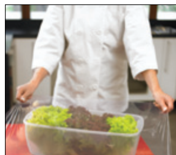
Mantiene los alimentos más frescos